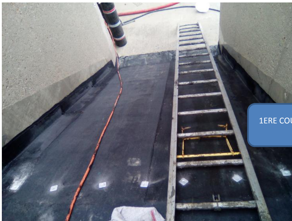
1ERE COUCHE AVEC FIXATIONS